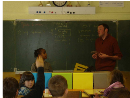
Ecole de La Motte du Caire (SIVU de La Motte-Turriers)

Ils ont été présents sur des stands lors de grandes manifestations comme la Foire de la lavande ou la fête de la Terre ; mais aussi, lors de réunions publiques, ils ont ainsi pu répondre aux questions de plus de 1 100 personnes.