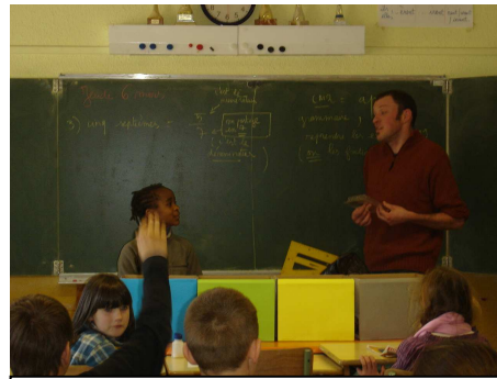
Ecole de La Motte du Caire (SIVU de La Motte-Turriers)

Ils ont été présents sur des stands lors de grandes manifestations comme la Foire de la lavande ou la fête de la Terre ; mais aussi, lors de réunions publiques, ils ont ainsi pu répondre aux questions de plus de 1 100 personnes.