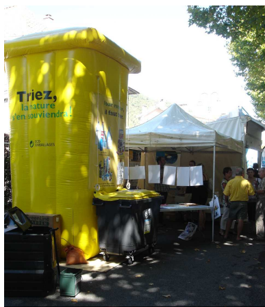
Foire de la lavande (Digne Les Bains)

Ils ont été présents sur des stands lors de grandes manifestations comme la Foire de la lavande ou la fête de la Terre ; mais aussi, lors de réunions publiques, ils ont ainsi pu répondre aux questions de plus de 1 100 personnes.