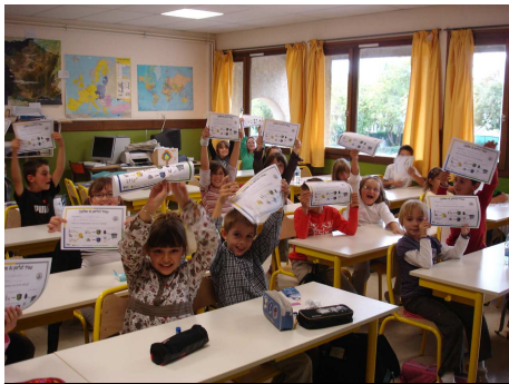
Ecole de Peipin (SMIRTOM du Canton de Volonne)

Ils se sont rendus dans différentes écoles du département et ainsi rencontré plus de 1 040 élèves âgés de 6 à 13 ans.