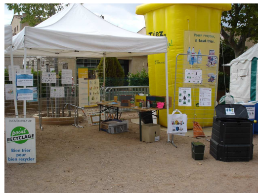
Fête du Parc Naturel Régional du Verdon (Les Salles sur Verdon)

Pour améliorer la communication et la diffusion de l'information, les ambassadeurs du tri se sont aussi rendus dans plusieurs collectivités afin de rencontrer les élus et les agents, puis de répondre à leurs questions concernant la gestion des déchets sur le département.