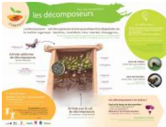
Panneau pédagogique "Les décomposeurs"