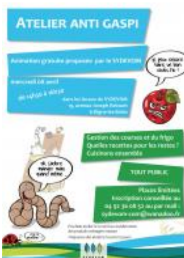
Affiche "Atelier ANTIGASPI" tout public