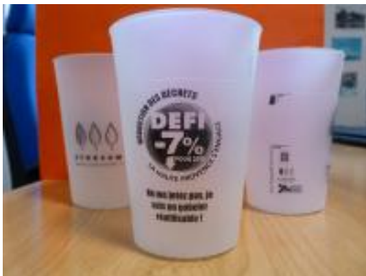
Exemple de gobelets "SYDEVOM" couleur noir