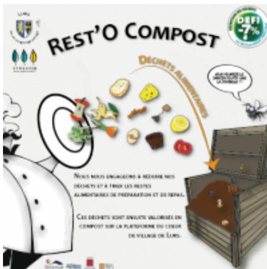
Label Rest'o compost

Sur la base du projet ALCOTRA arrivé à terme en fin d'année 2011, il s'agit de s'inspirer de la plateforme de compostage du Verger située à St Geniez (secteur SMITOM du Sisteronais) pour inciter les adhérents à développer sur leur territoire des projets de compostage à l'échelle d'un quartier, d'un hameau ou cœur de village.