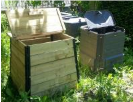
Composteurs bois et plastique

Pour les 5 années de réalisation du programme de prévention, l'action consiste à continuer de distribuer des composteurs domestiques aux administrés par l'intermédiaire des collectivités adhérentes du SYDEVOM avec un objectif de 1 000 composteurs par an.