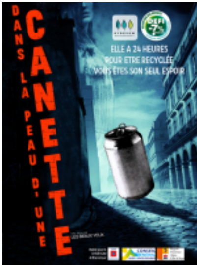
Affiche de lancement du film "dans la peau d'une canette"

Le SYDEVOM s'est engagé depuis le 10 décembre 2010 dans un Programme Local de Prévention des déchets portant sur la quantité et la nocivité des déchets produits sur son territoire. Le SYDEVOM a donc mis en œuvre depuis 2011 un programme d'actions visant à réduire de 7 % en 5 ans la production de déchets. Dans le cadre de son action n°1 "communication sur la prévention et le Programme Local de Prévention" faisant partie intégrante de l'axe « n°1 » du Programme Local de Prévention (sensibilisation des publics à la prévention), l'équipe du SYDEVOM a décidé de créer ses propres films pédagogiques 100% Alpes de Haute Provence.