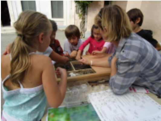
Photo d'un atelier pédagogique sur la dégradation des déchets verts

Dans le cadre de son action n°2 "communication auprès des scolaires sur la prévention" faisant partie intégrante de l'axe n°1 du Programme Local de Prévention (sensibilisation des publics à la prévention), l'équipe du SYDEVOM a créé et réalisé des ateliers pédagogiques sur le thème de la réduction des déchets : compostage et récupération.