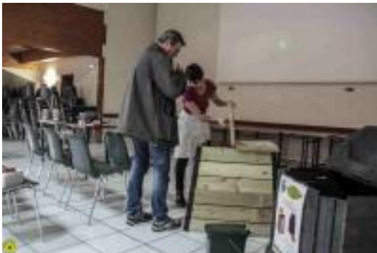
Atelier matin dédié au compostage

Proposer aux adhérents du SYDEVOM un accompagnement technique de leur opération compostage Accompagner les usagers dans leur pratique du compostage dès l'acquisition du composteur tout comme son utilisation dans la durée